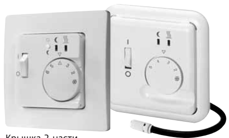
Крышка 2 части, 50-50 мм